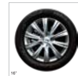
Trên phiên bản GS