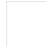
Trắng Pha Lê