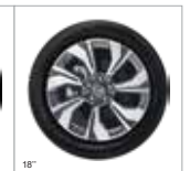
Trên phiên bản GL