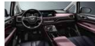
Đỏ / Đen